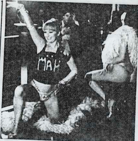
(yllä) Nalleposti T-pordan ensimmäinen jullainen esittelytilaisuus kaikille mainosmaailman silmätelkeville.