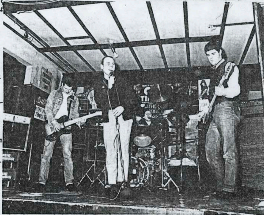
Oil-Band „The 4 Skins“ Ole muodikas! Kuuntele oi-to!