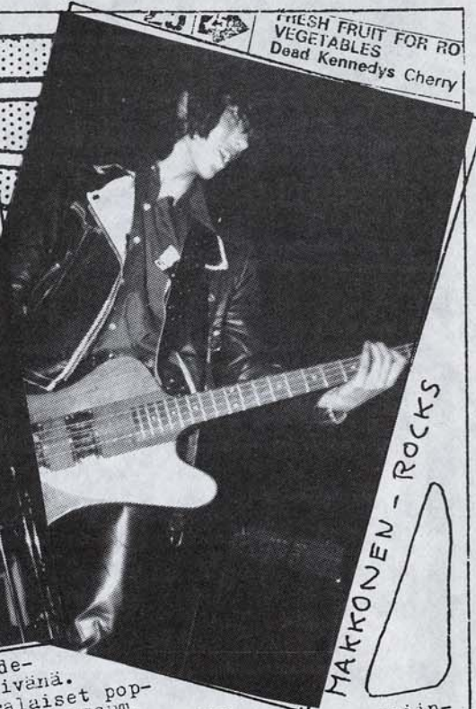
MAKKONEN - ROCKS

Sitten Imatralla oli nuorison taide- tapahtuma maaliskuun viidentenä päivänä. Tapahtumassa soitti sellaset imatralaiset pop- yhtyeet kun TOP CANDY, NEUTRAL PLUS, IHMISET, SIDE STREET ja UHO. Tuomariston mukaan Ihmiset ja Uno (ainoot kunnon rock-bändit) käyttivät liikaa volyyymia. Ihmisten esiin- tyminen oli kuulemma innotonta ja nyanssit puuttuivat. Uhon esiintymi- sessä oli korjaamisen varaa ja nyanssit puuttuivat. Läänintapahtumaan lähtee joko Top Candy tai Sidestreet (arpa ratkaisee).