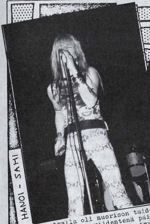
HANOI - SAMI

FRESH FRUIT FOR RO VEGETABLES Dead Kennedys Cherry